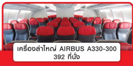
เครื่องลำใหญ่ AIRBUS A330-300 392 ที่นั่ง

สายการบิน THAI LION AIR ใช้เครื่อง AIRBUS A330-300 จำนวน 392 ที่นั่ง เครื่องใหม่ ลำใหญ่ มีจอทีวี การบริการทุกที่นั่ง จัดที่นั่งแบบ 3-3-3 มีบริการอาหารว่างเสิร์ฟทั้งขาไปและขากลับ (น้ำหนักกระเป๋า 20 กก./ท่าน หากต้องการซื้อน้ำหนักเพิ่ม ต้องเสียค่าใช้จ่าย)